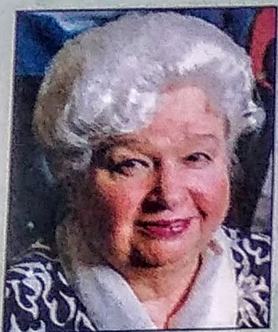
ГРЯЗНОВА Алла Георгиевна , ректор Финансовой академии при Правительстве Российской Федерации