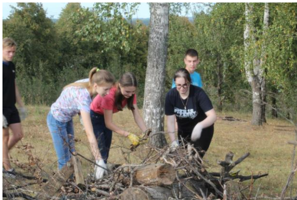
Участие в экологической акции «Чистый берег»

К участию в операциях «Школьный дворик», «Урожайная грядка», «Красивый поселок», «Чистый берег» в рамках работы досуговой площадки и работы летнего оздоровительного лагеря, волонтерского движения привлекаются практически все учащиеся школы. Ежегодно около 30 учеников проходят через программу трудоустройства учащихся, получают практический опыт работы и первый заработок за свой труд.