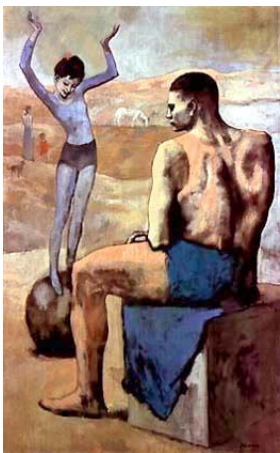
«Девочка на шаре», 1905

Первые значительные произведения относятся к началу 1900-х. Картины «голубого периода» (1901—1904), написанные в сумрачной, почти монохромной гамме голубых, синих и зеленых тонов, и «розового периода» (1905—1906), в колорите которых преобладают розово-золотистые и розово-серые оттенки, посвящены теме трагического одиночества обездоленных (слепых, нищих, бродяг), романтической жизни странствующих комедиантов. Они исполнены острого, подчас горького чувства утраченной или ускользающей, мимолетной гармонии человека с миром («Старый нищий с мальчиком», 1903; «Девочка на шаре», 1905).